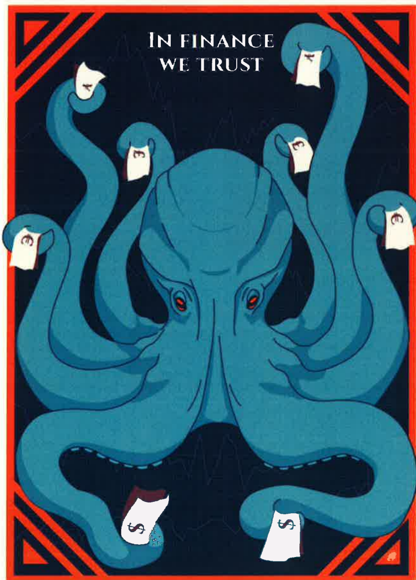
Margot Raillé, Octopus